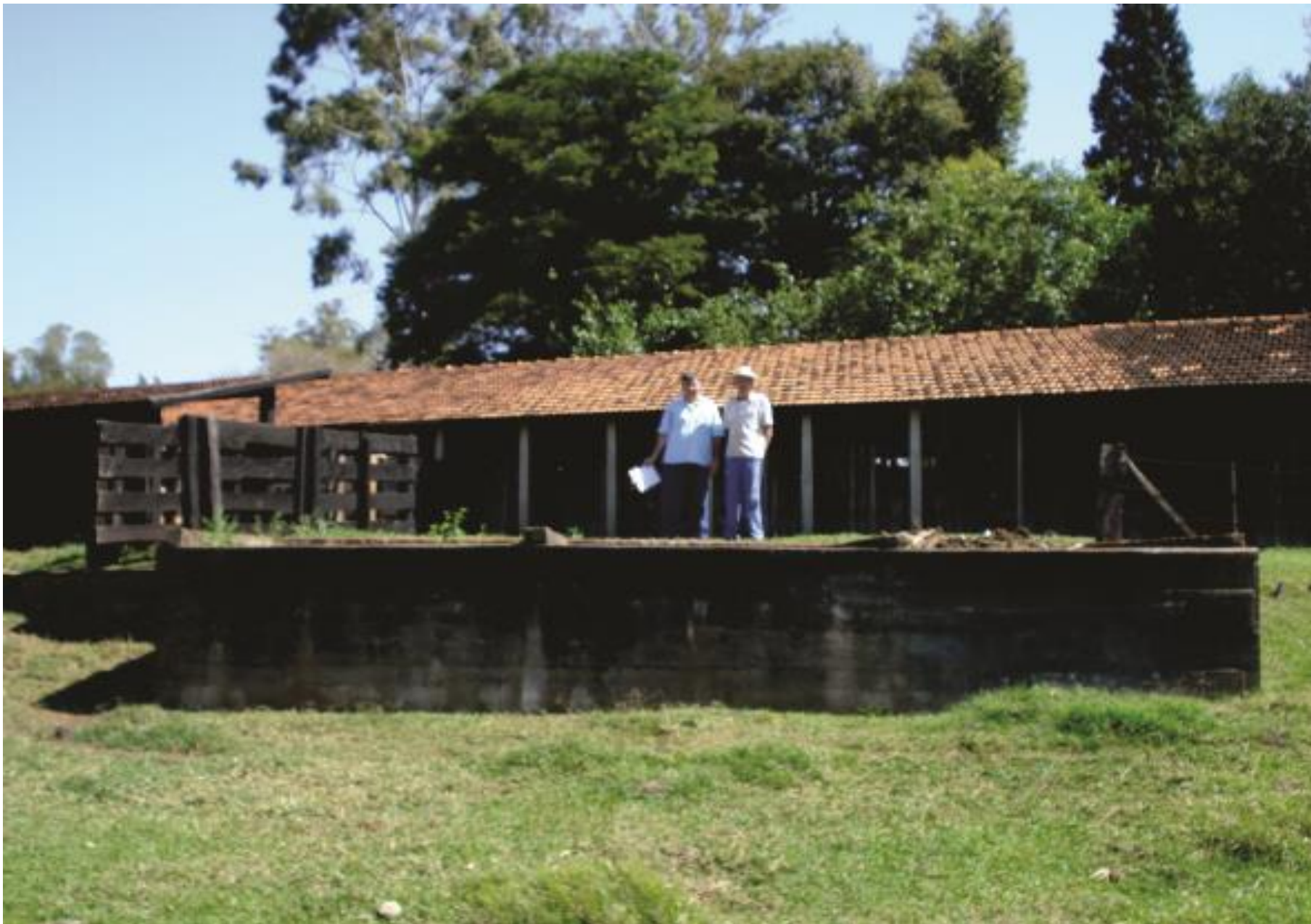
Local para encostar o trator com a carreta