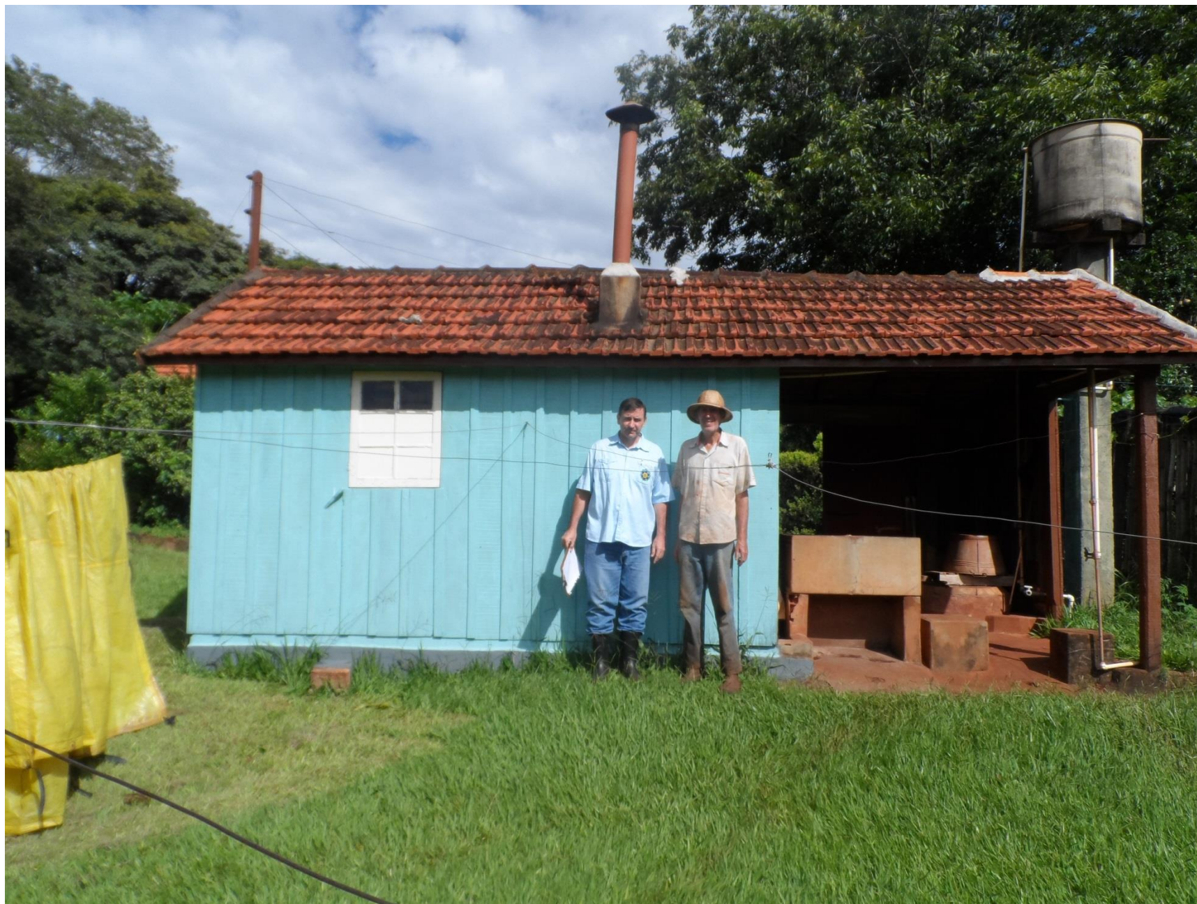
Construção com poço de água, fogão a lenha, tanque de lavar roupa, sauna, chuveiro e vaso sanitário