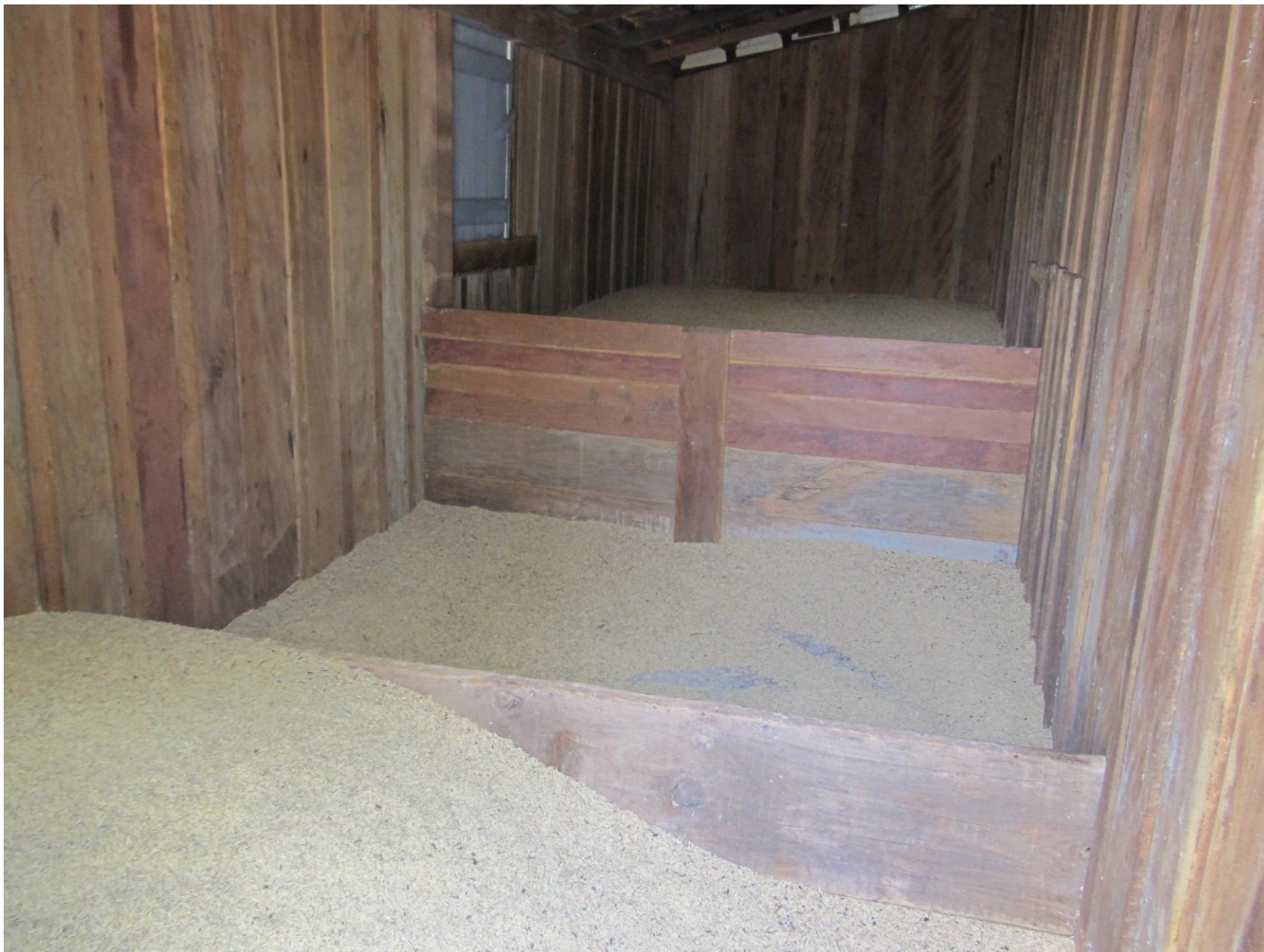
Arroz em casca armazenado