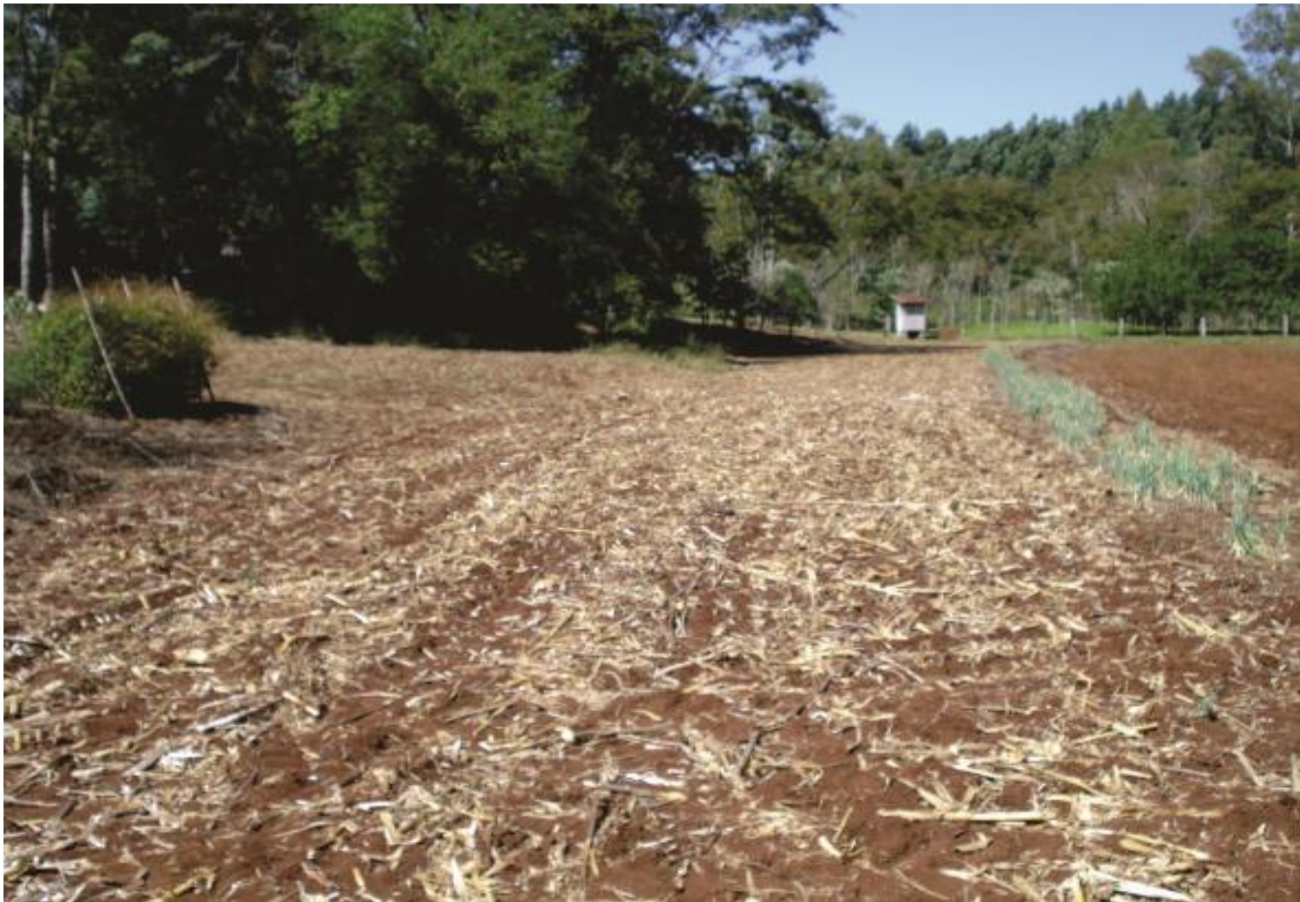
Área para plantio de arroz irrigado