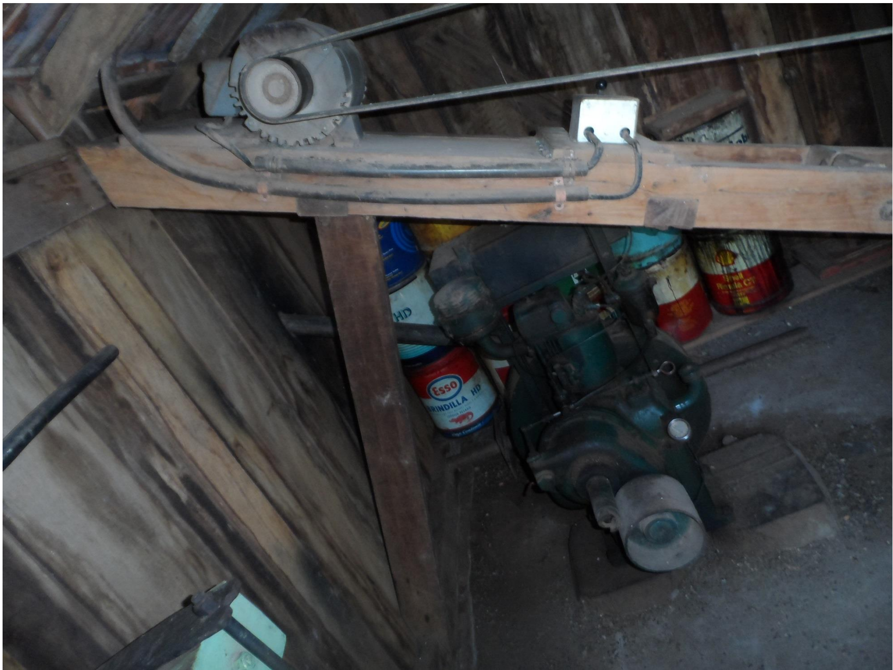
Motor à diesel e motor elétrico