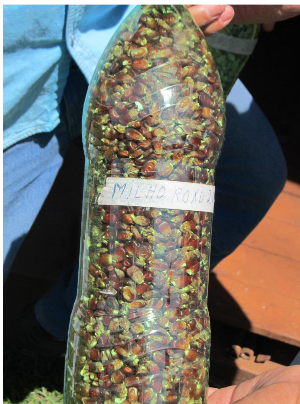
Sementes de milho preto