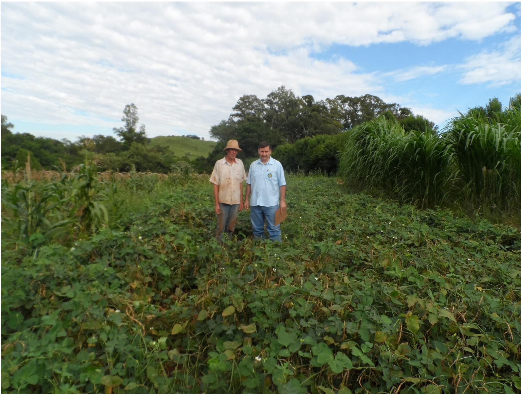
Feijão fradinho em rotação com o morango