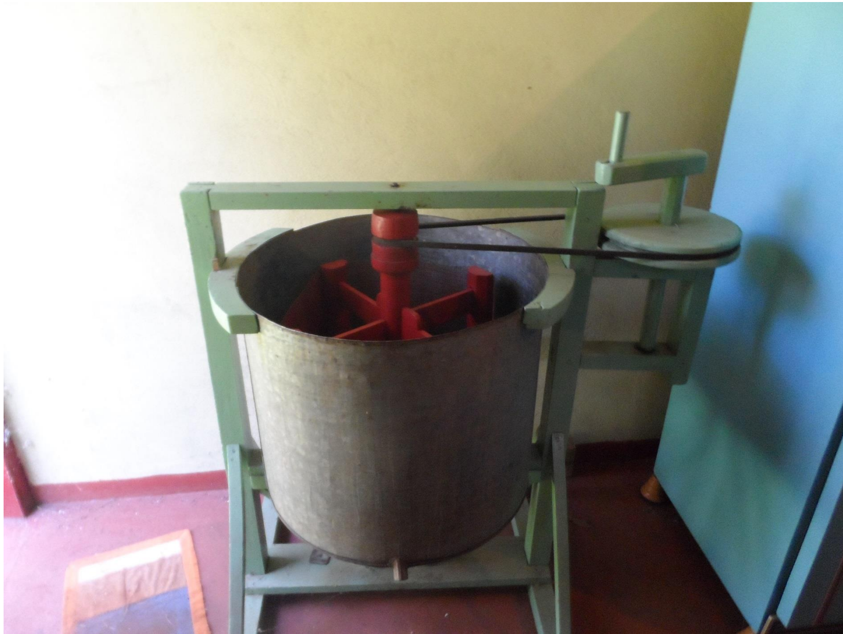
Centrifuga manual para extrair mel do favo