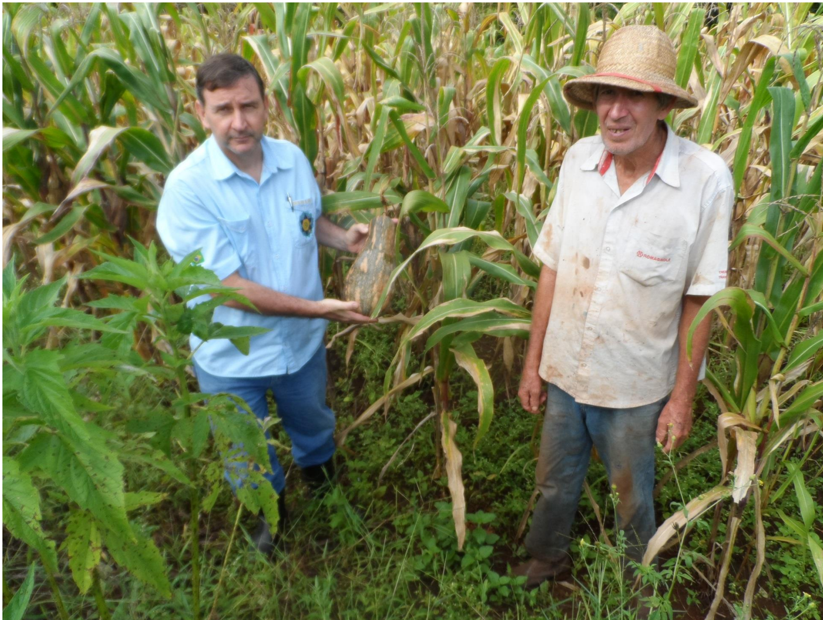
Milho com abóbora