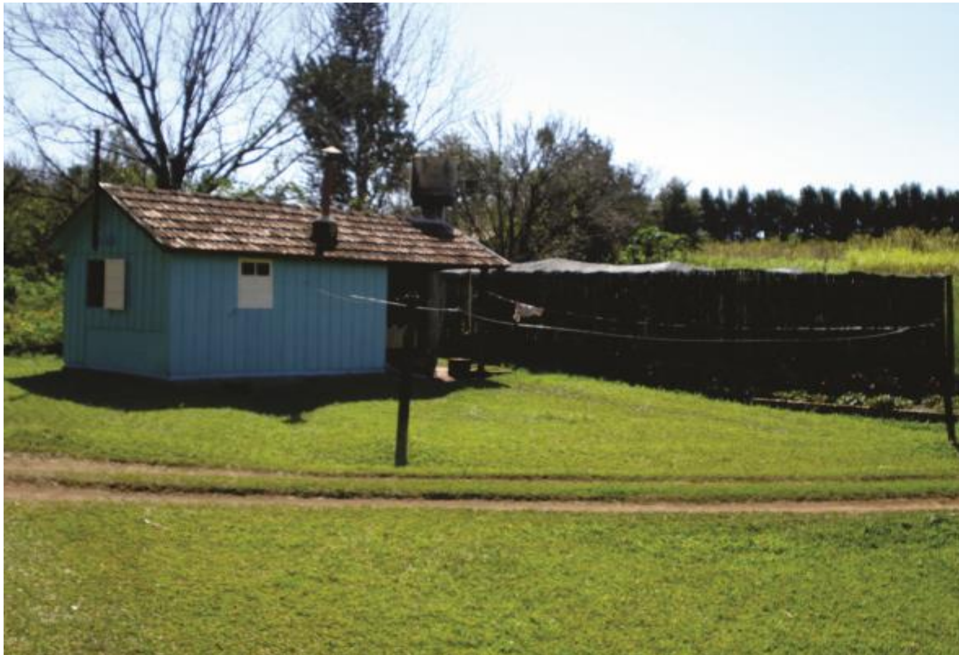
Área com sombrite para produção de mudas