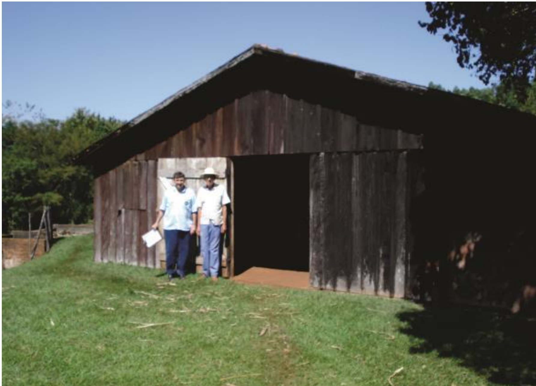
Curral de ordenha