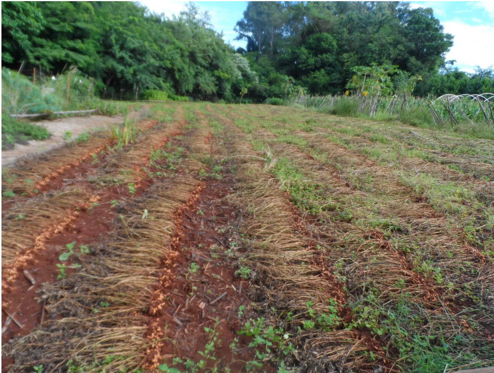
Rotação de cultura, milho, amendoim e morango