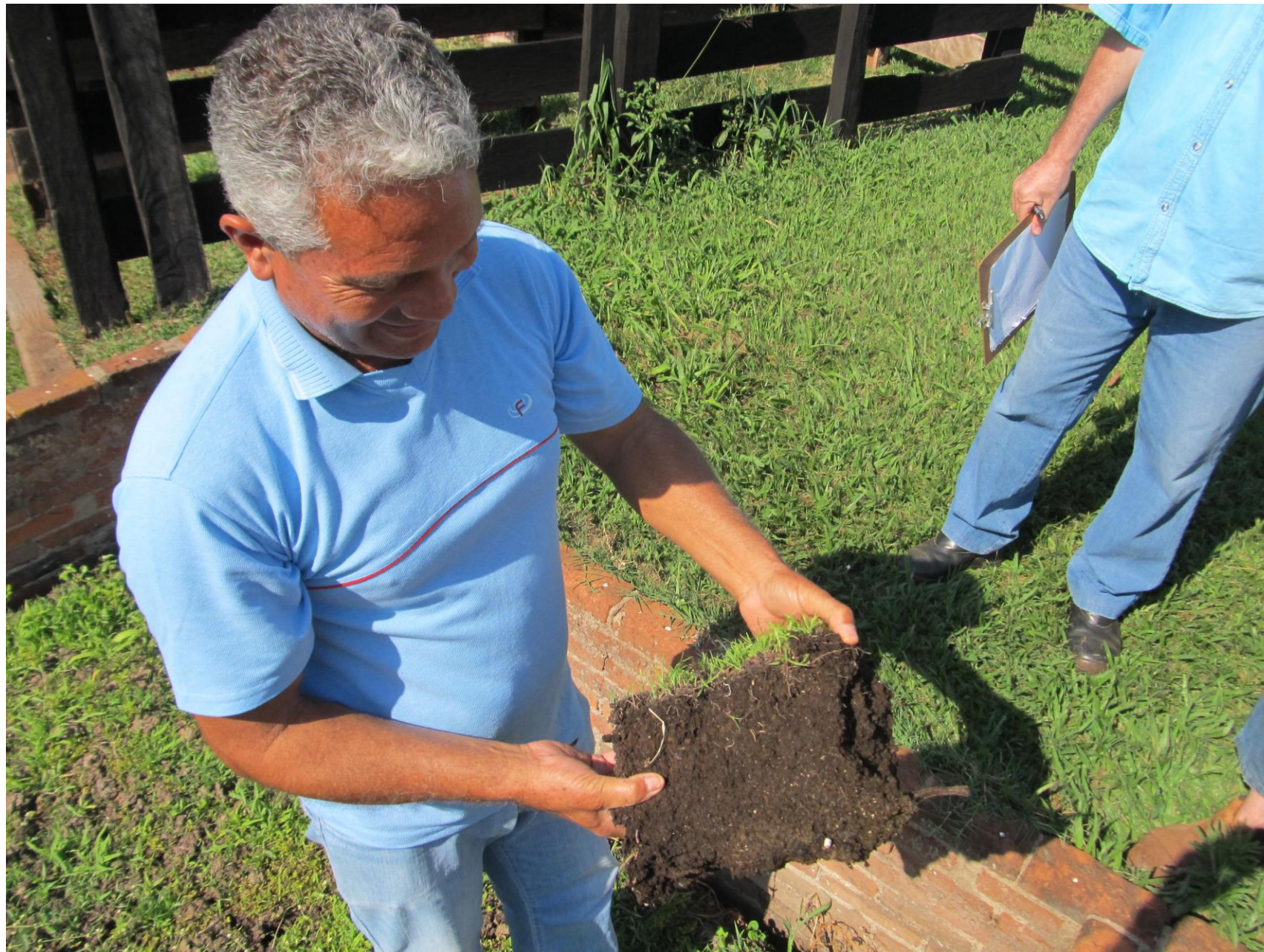
Esterco curtido durante sete meses