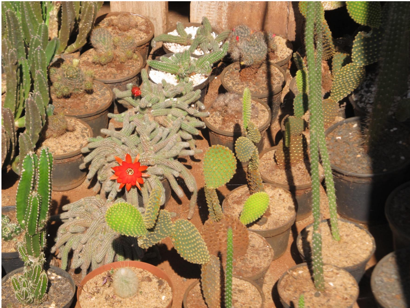
Coleção de cactos