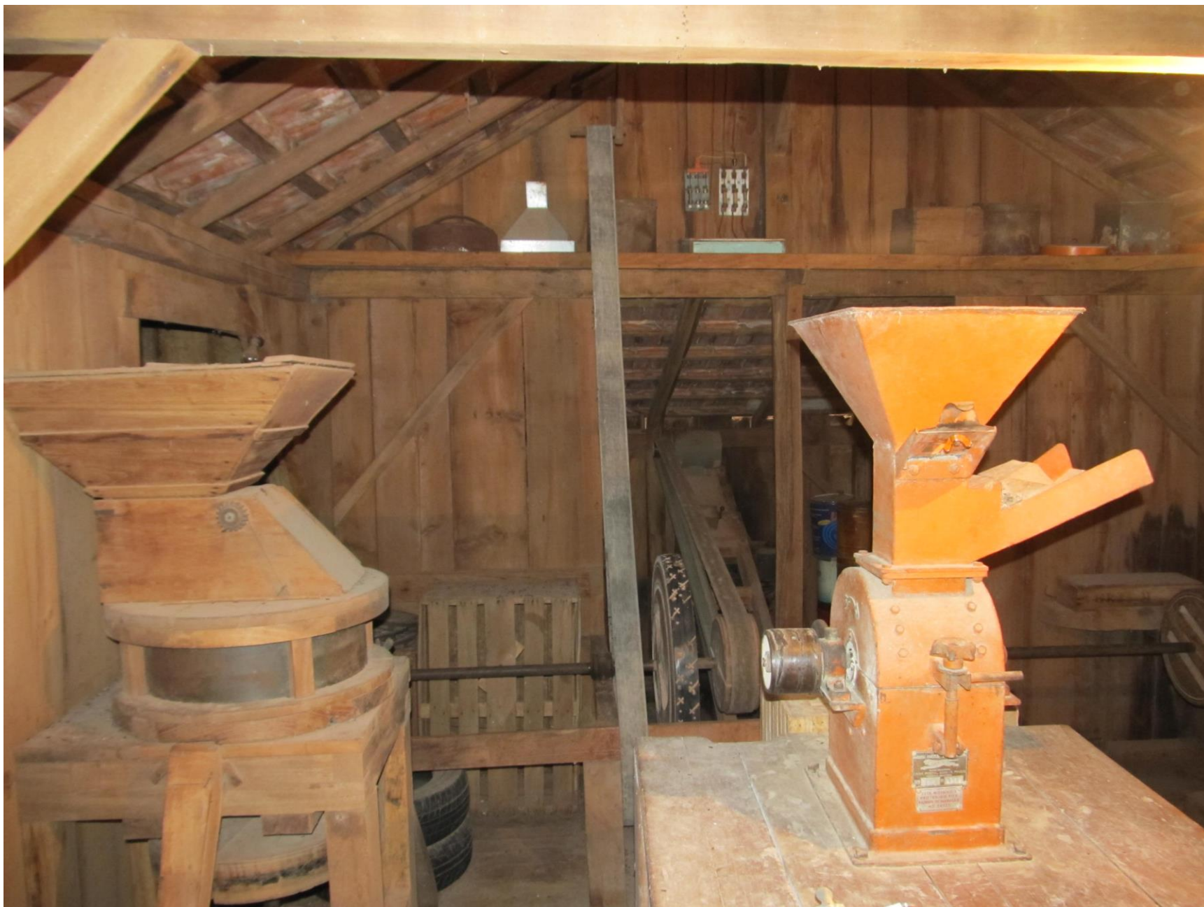
A esquerda moinho de pedra (2) para esmagar trigo ou milho, a direita triturador comercial de milho