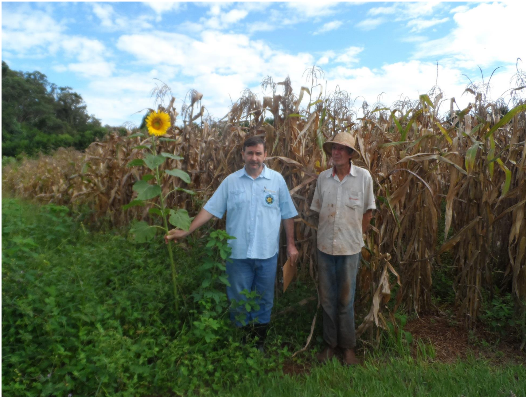
Milho preto em rotação com o morango