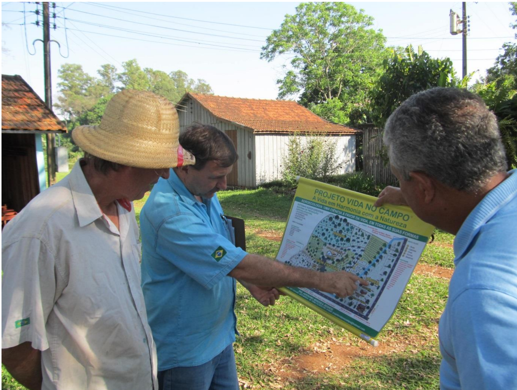
O Projeto Vida no Campo é parceiro do sítio Rochedo