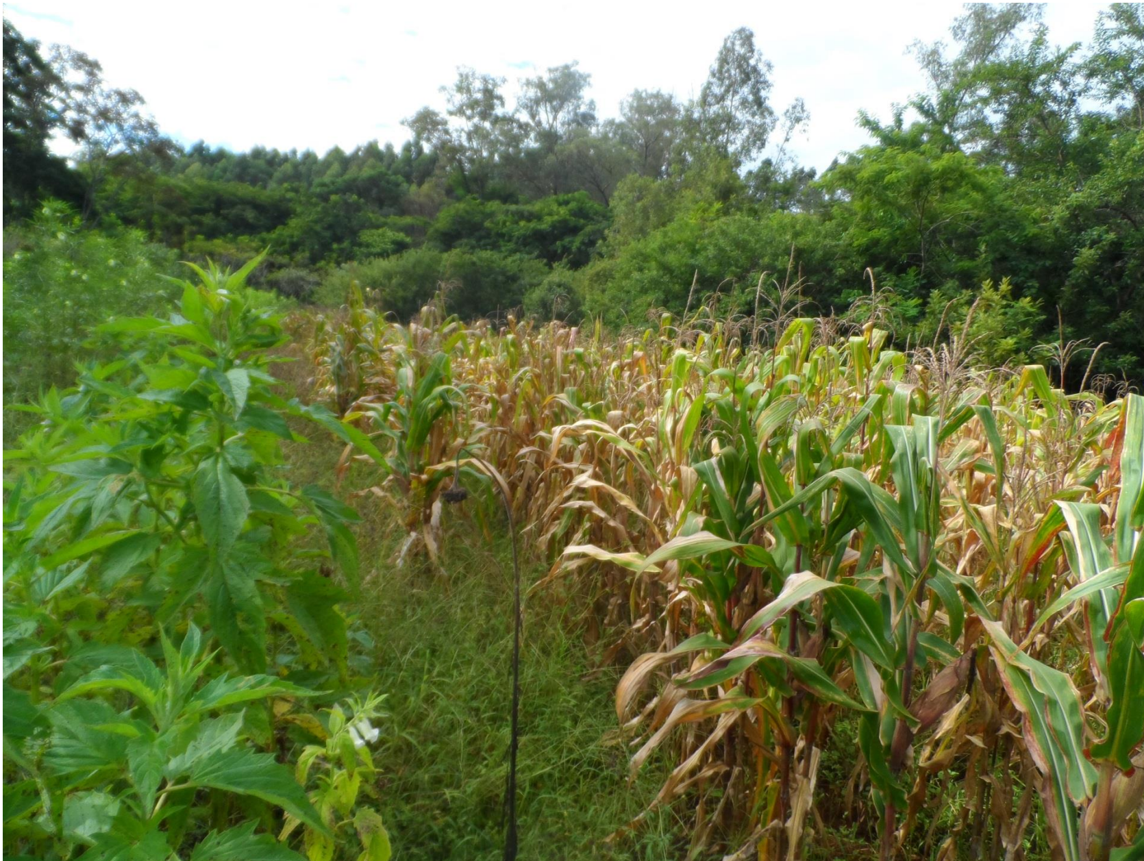
Rotação de cultura, milho com arroz