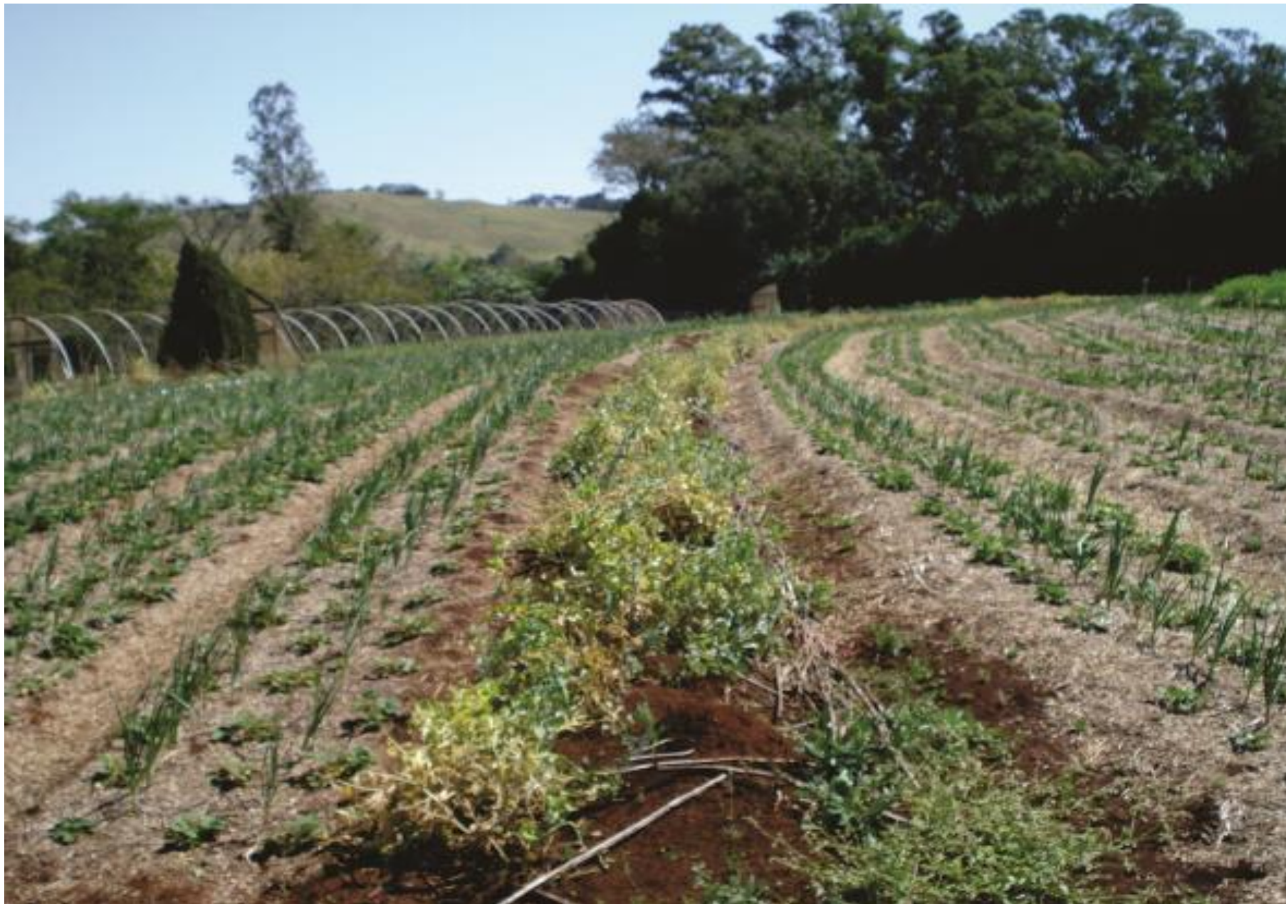
Faixa com ervilha