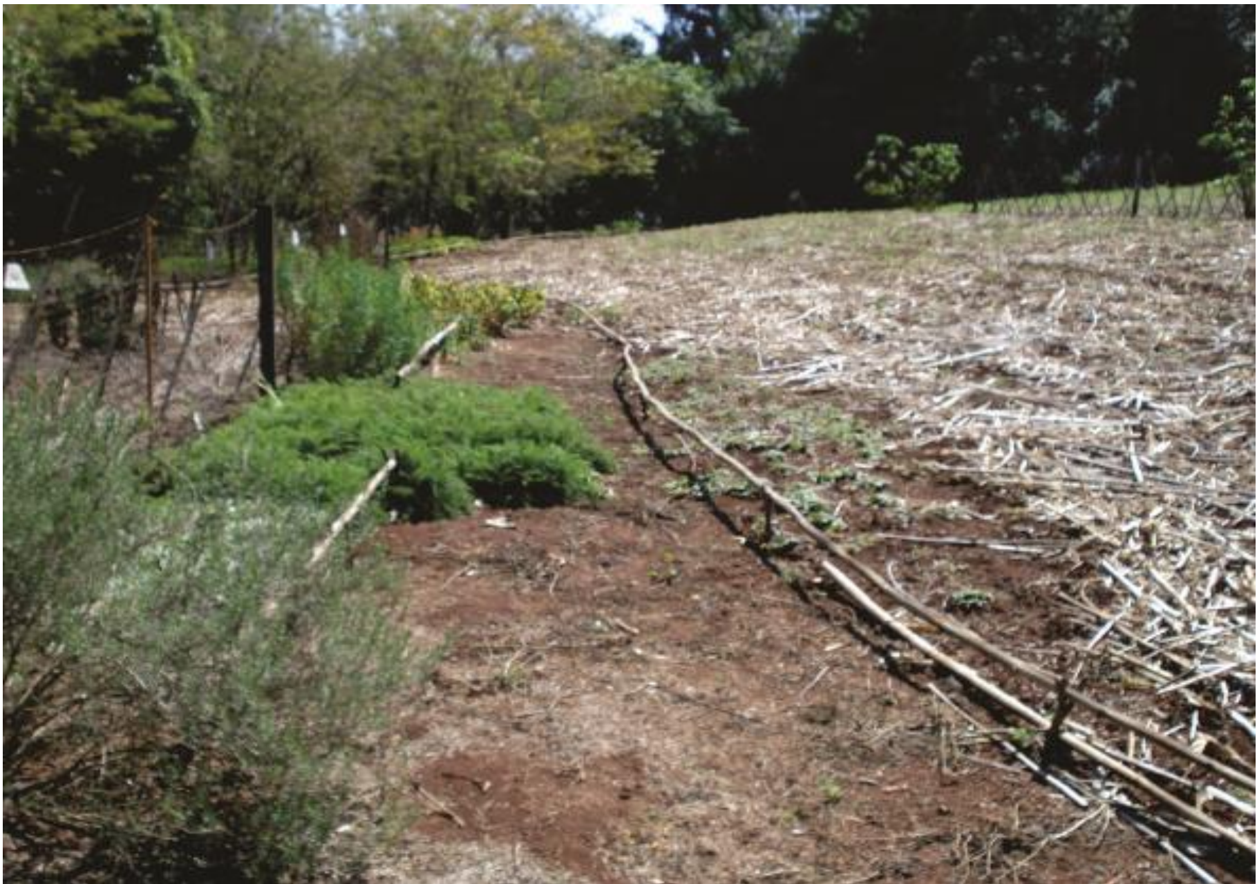
Coleção de plantas medicinais e aromáticas