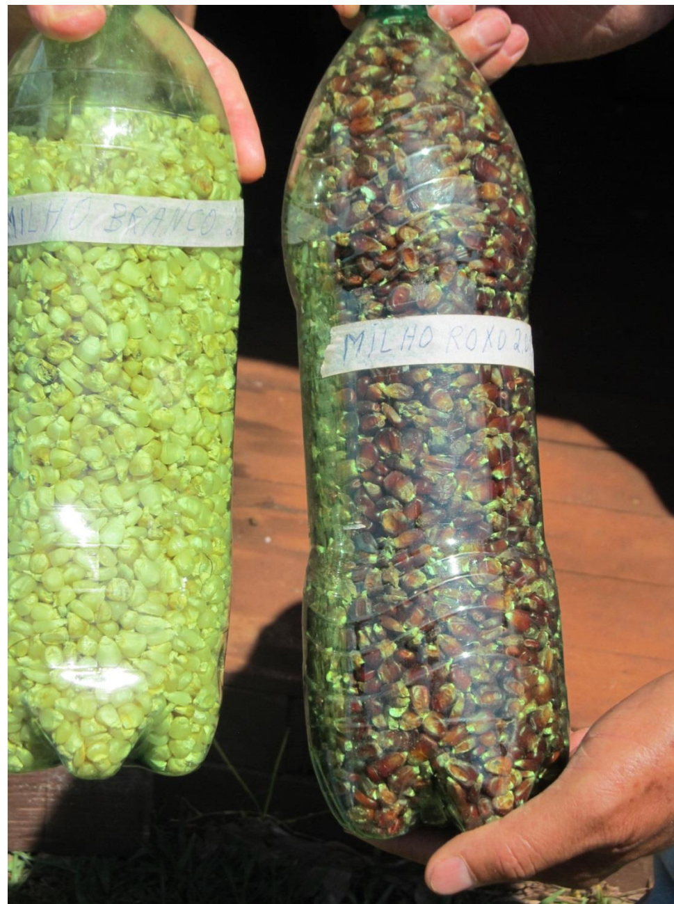
Sementes de milho branco