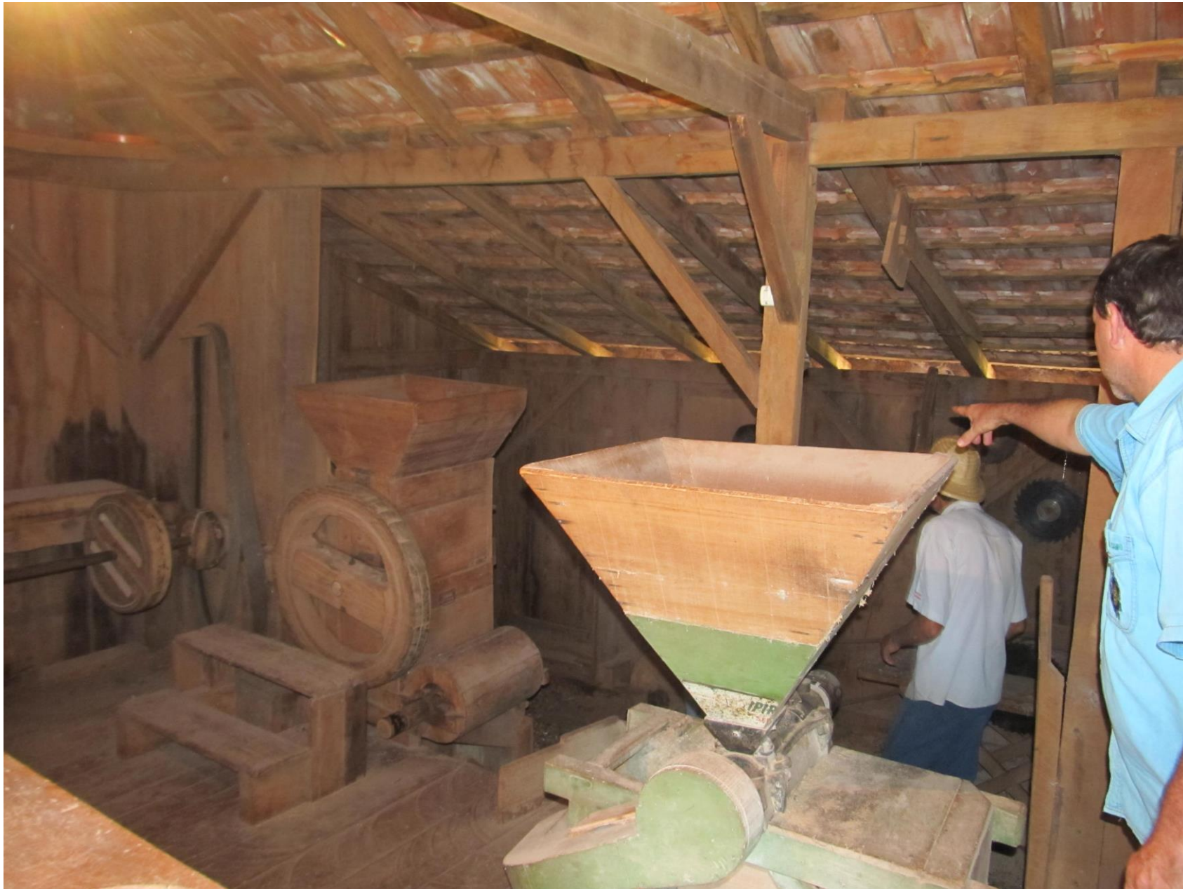
Descascador de arroz