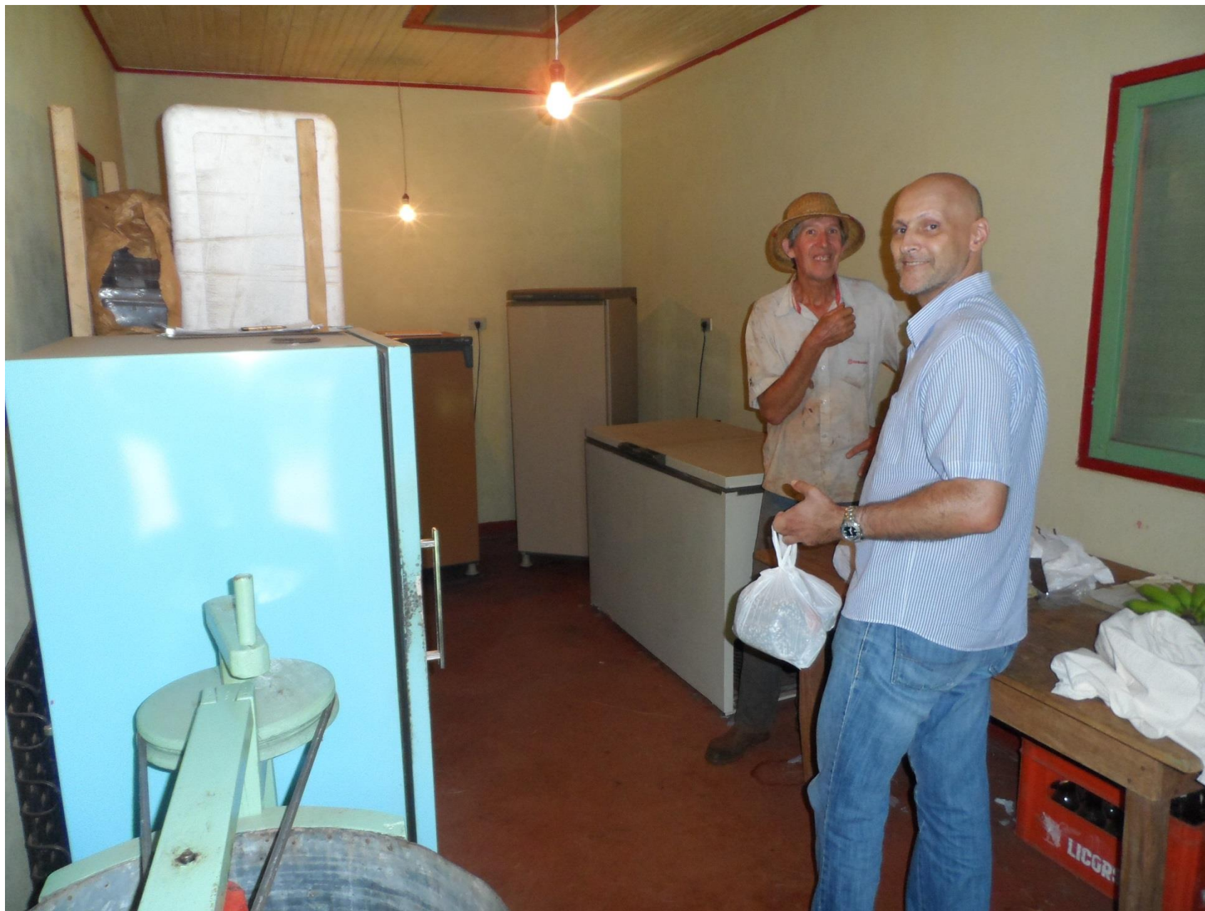
Venda direta ao consumidor