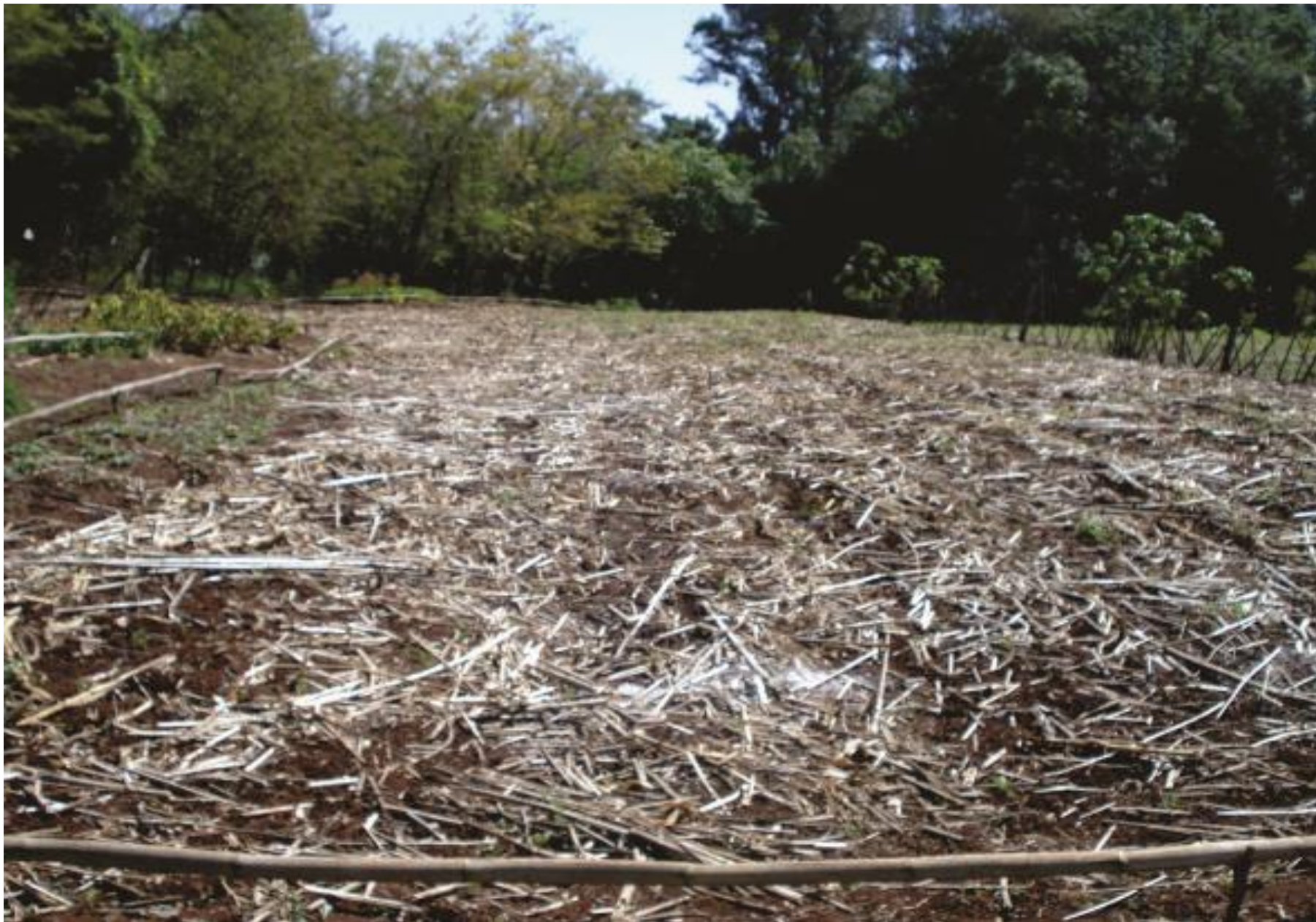
Colheu milho e irá plantar amendoim