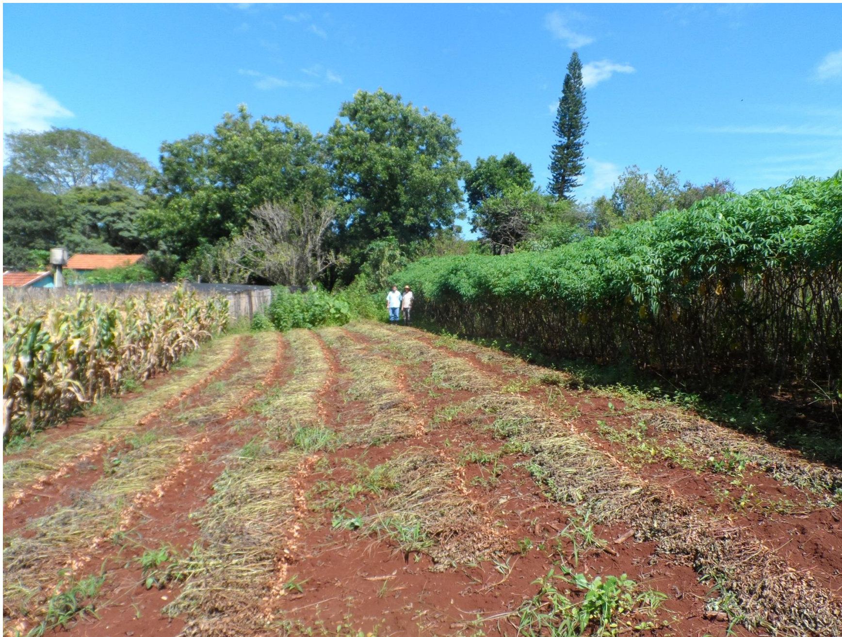
Milho branco e amendoim em rotação com a linhaça e mandioca de mesa