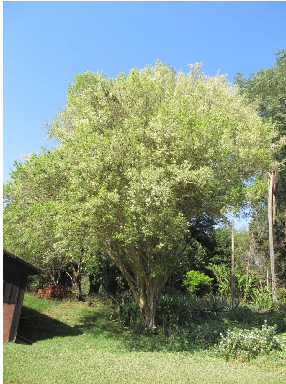
Pitangueira pé franco