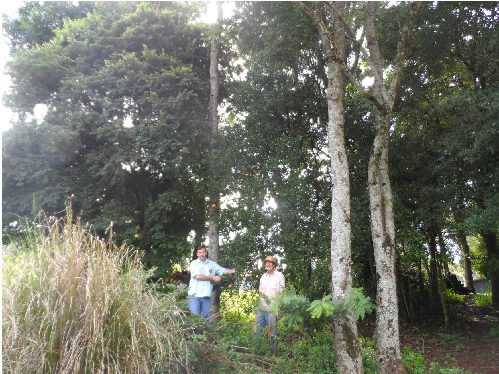
A esquerda gabioba, a direita mexerica em Sistema Agroflorestal