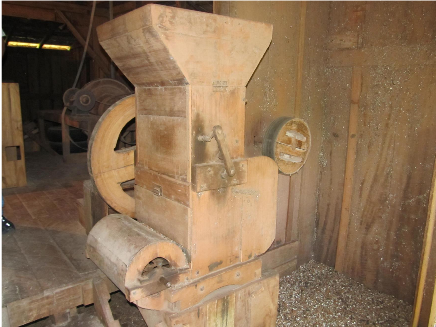
Descascador de amendoim