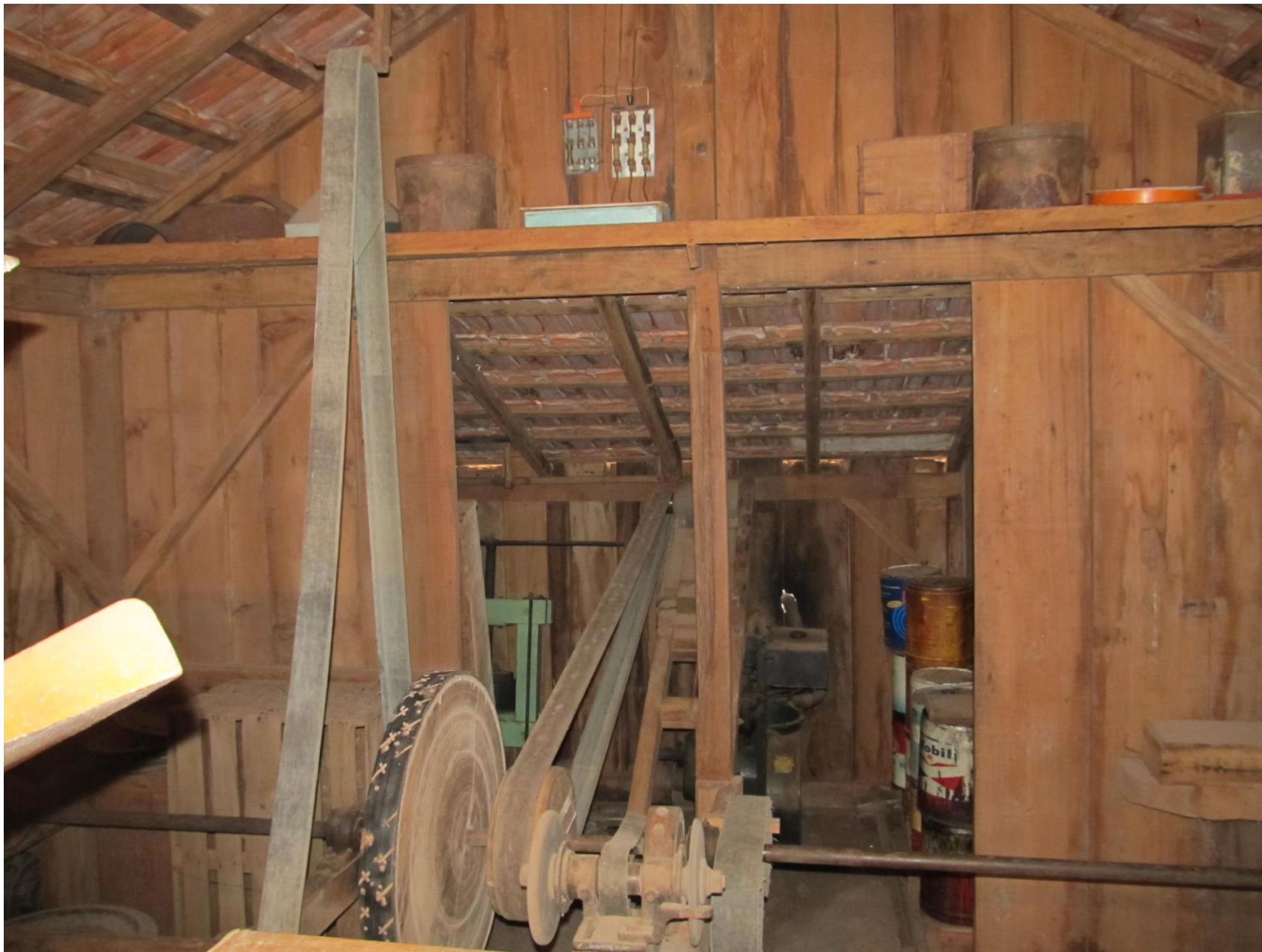
Unidade de beneficiamento de sementes