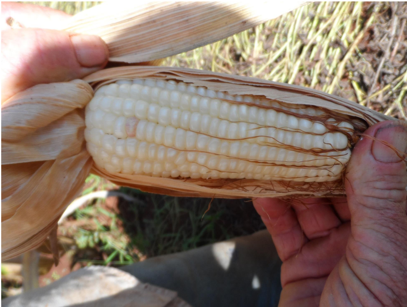
Espiga de milho branco