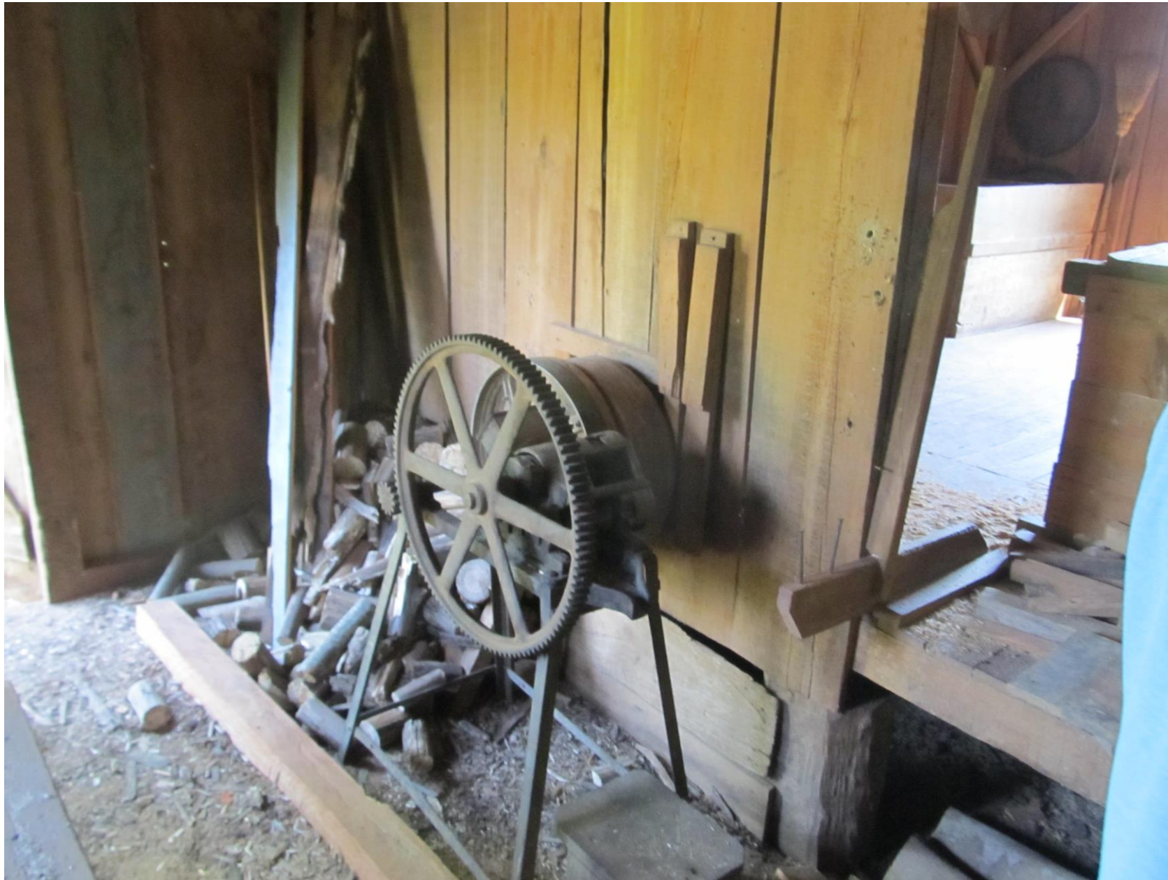
Moedor de cana-de-açúcar