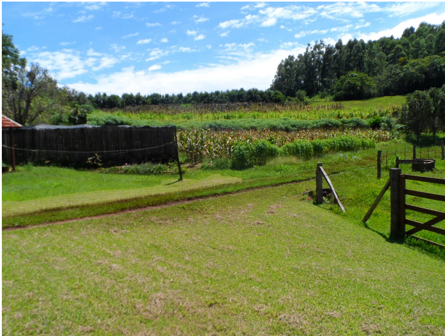
Rotação de cultura, milho branco com linhaça