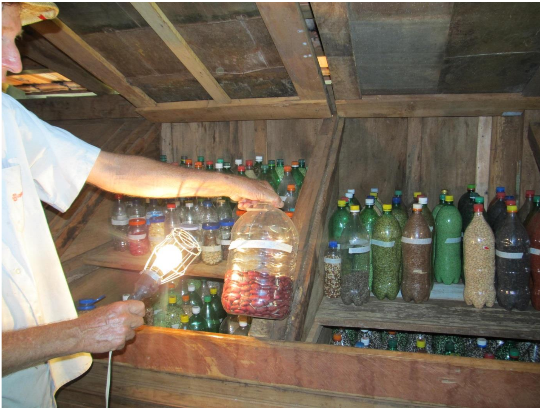
Banco de sementes crioula