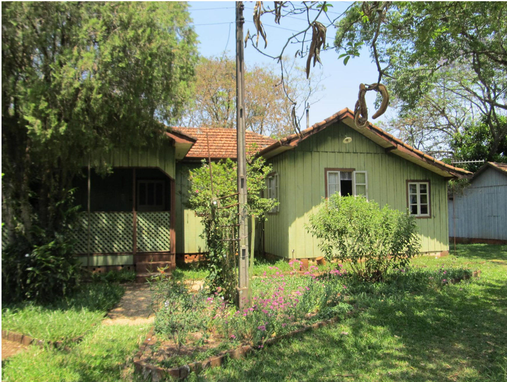
Residência dos pais do senhor Lauro