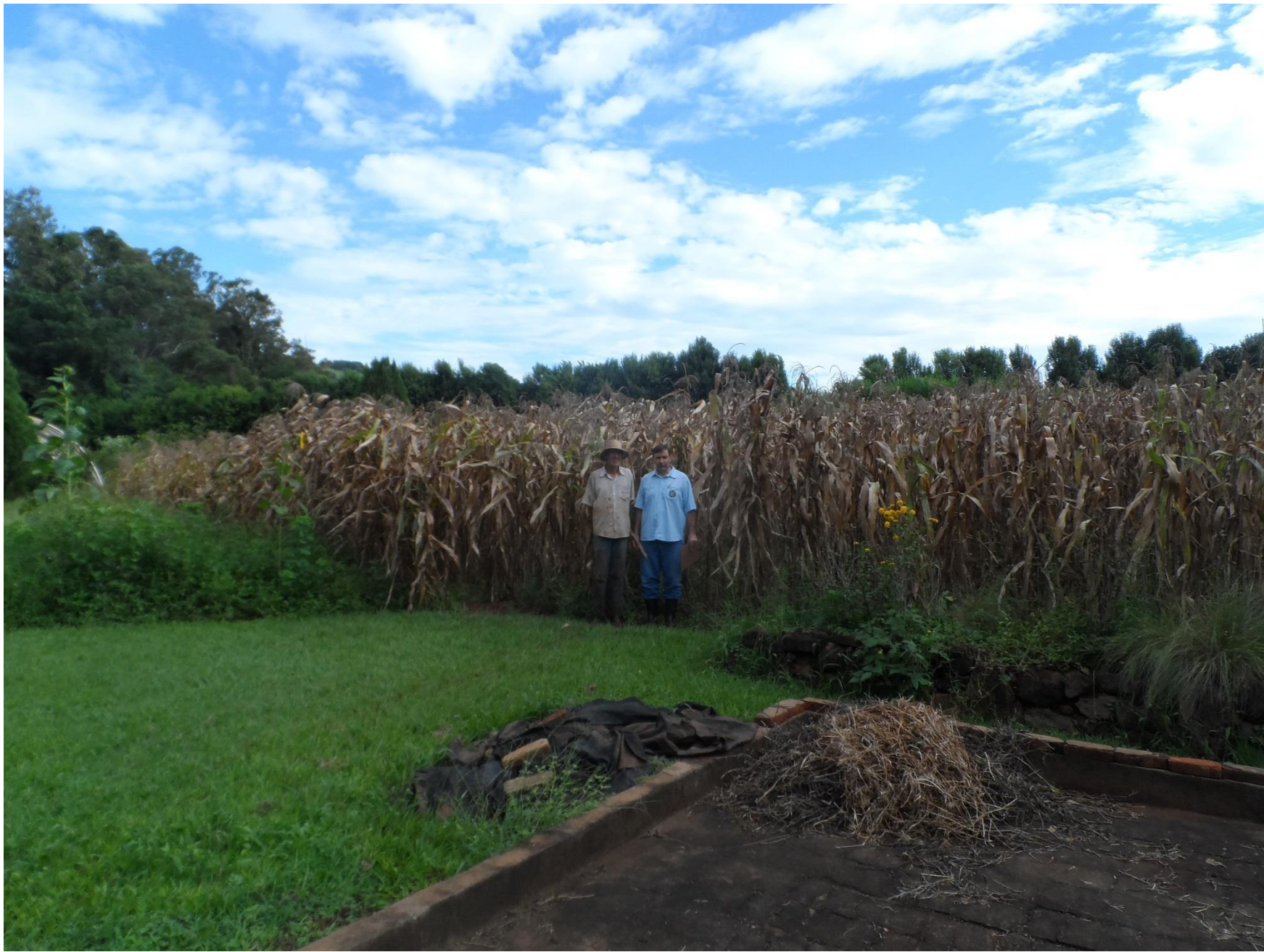
Terreiro de tijolo