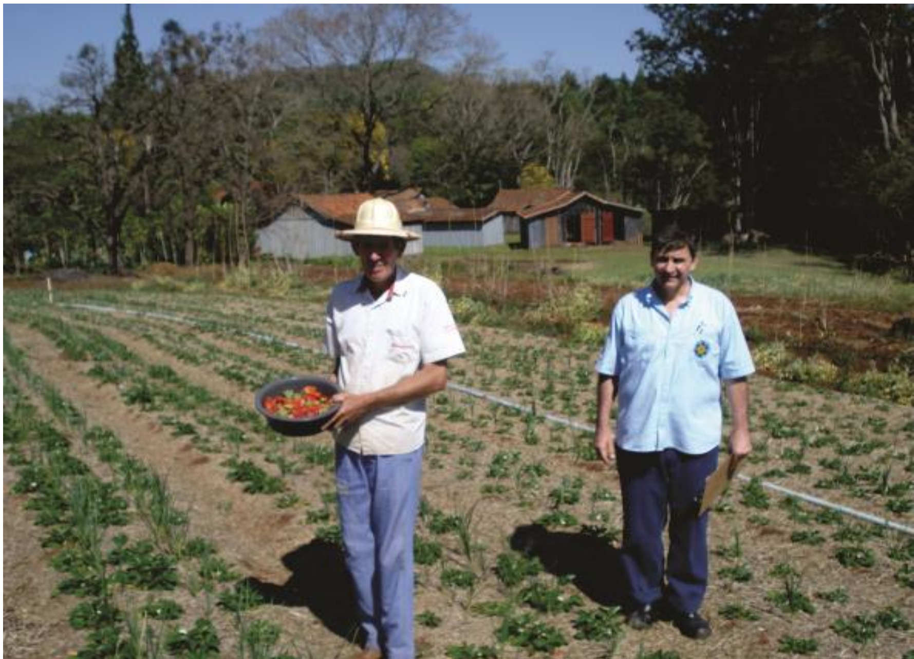
Cultivo de morango com alho