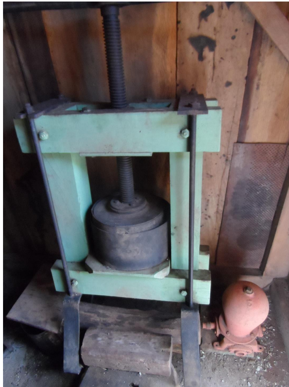
Prensa manual para extrair óleo de amendoim