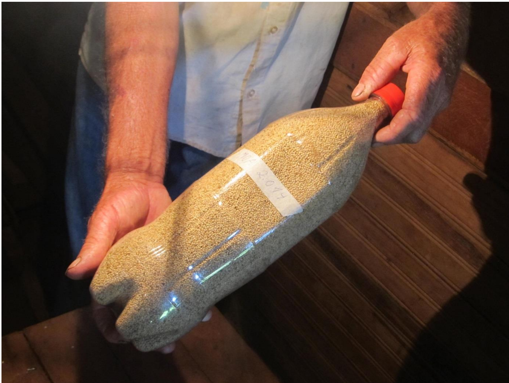
Sementes de gergelim