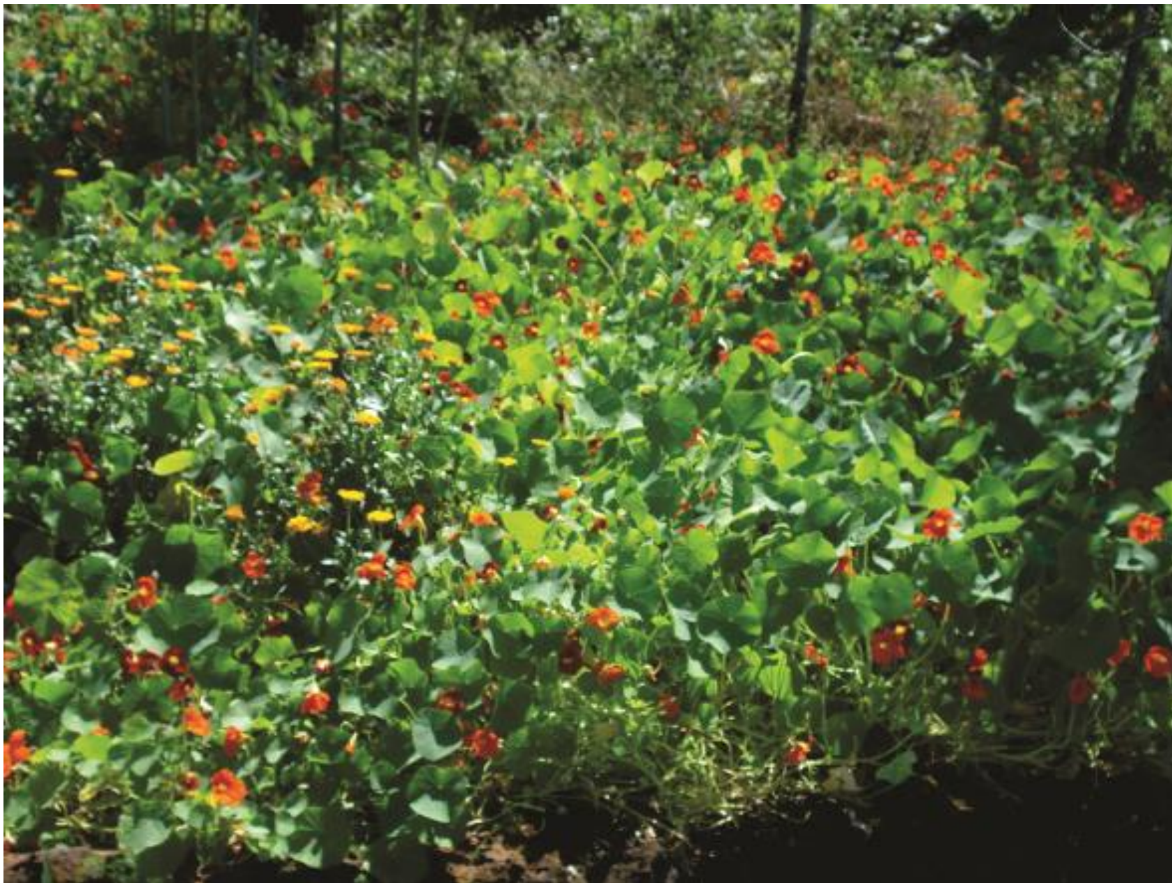
Flor comestível, agrião do Peru