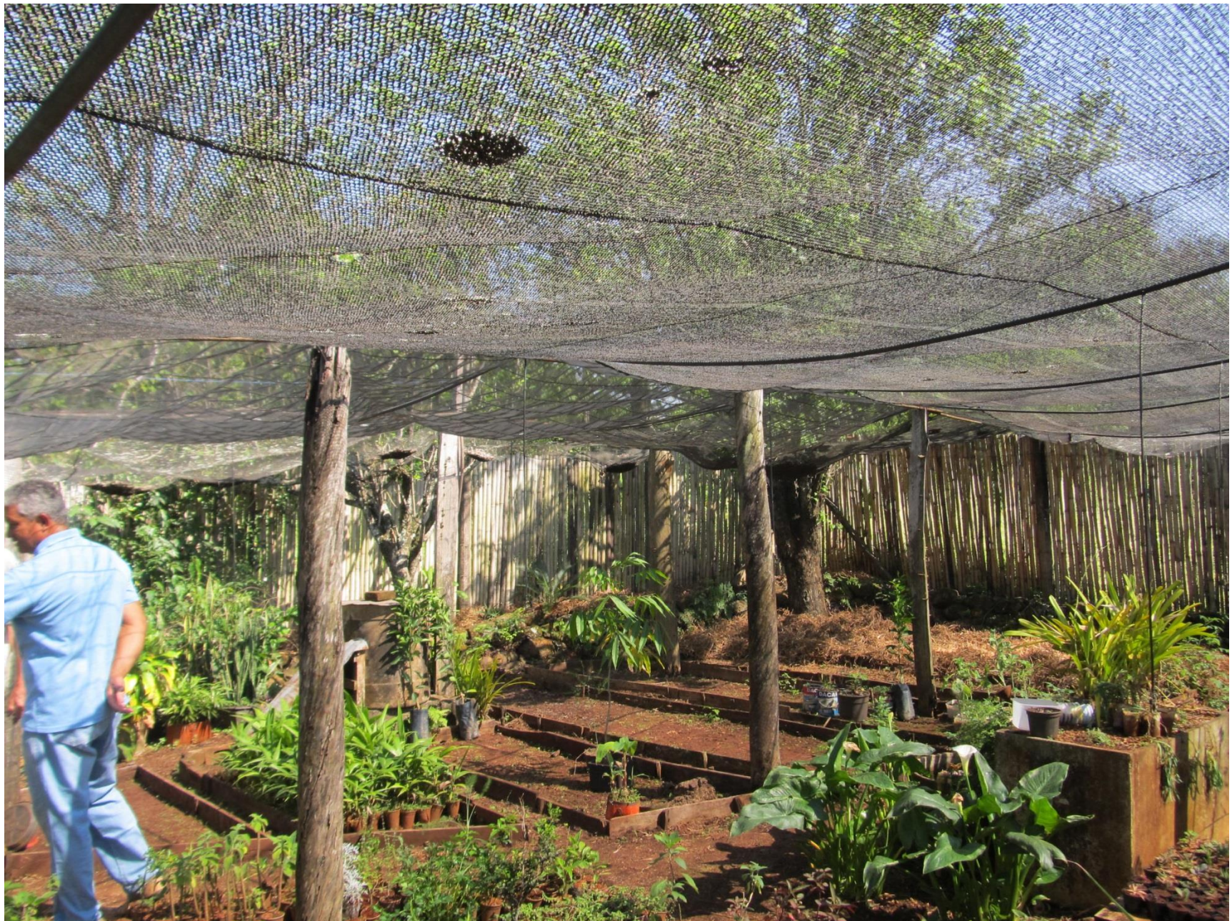
Diversidade de plantas