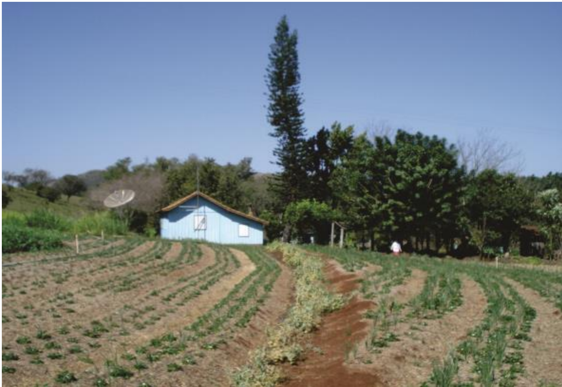
Residência do senhor Lauro