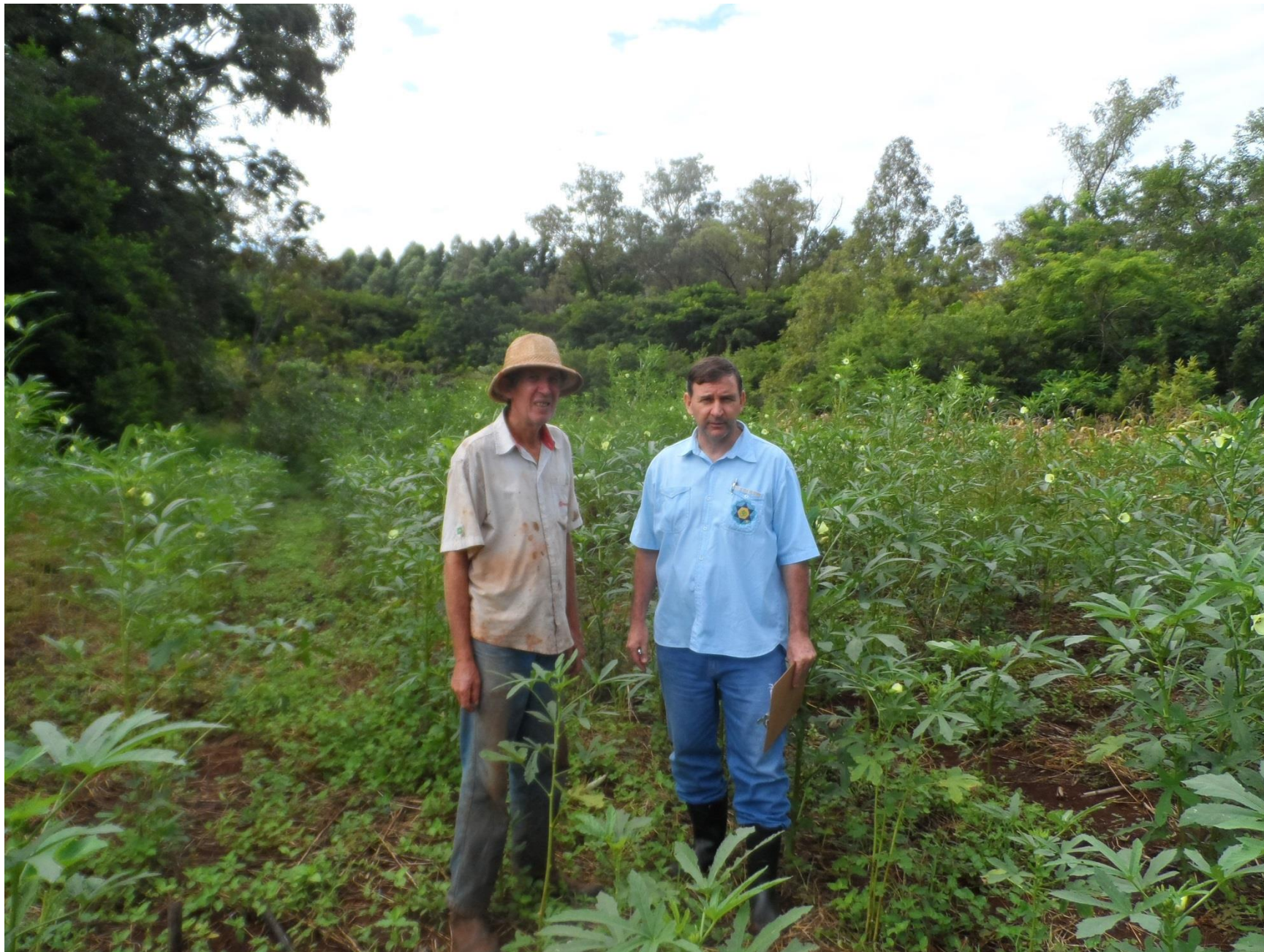
Rotação de cultura, quiabo com arroz