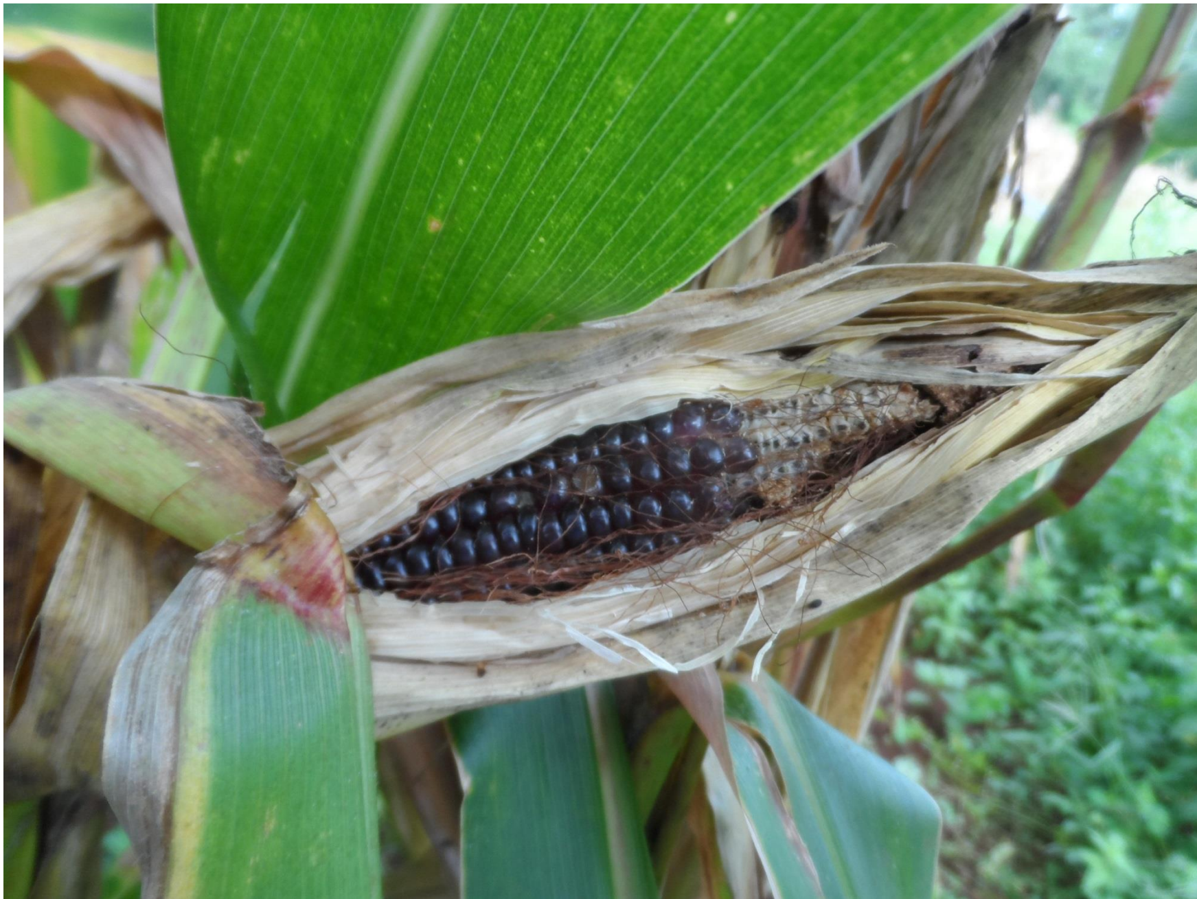
Espiga de milho preto